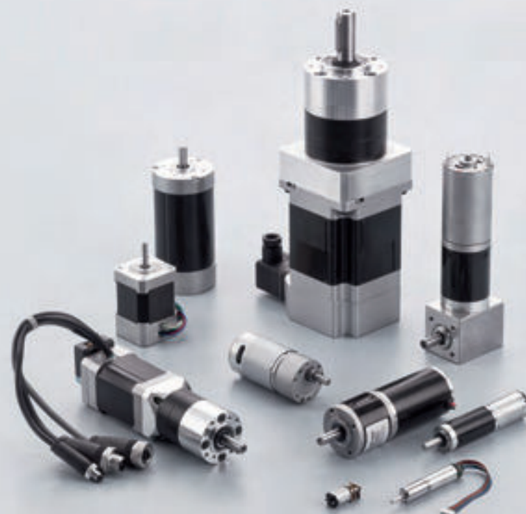
Kompakte BLDC-Getriebemotoren: Präzise, langlebig und hochwertig.

BADISCH-WÜRTTEMBERGISCHE TREUHAND BWT WIRTSCHAFTSPRÜFUNGSGESELLSCHAFT STEUERBERATUNGSGESELLSCHAFT