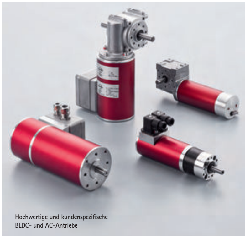
Hochwertige und kundenspezifische BLDC- und AC-Antriebe