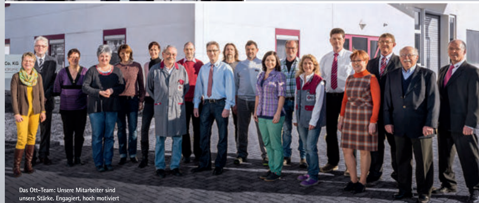
Das Ott-Team: Unsere Mitarbeiter sind unsere Stärke. Engagiert, hoch motiviert und fachlich versiert für Sie da.