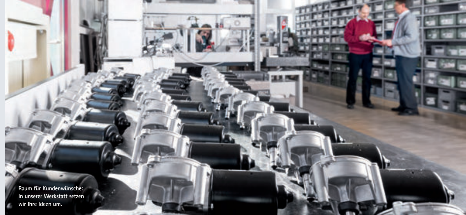
Raum für Kundenwünsche: In unserer Werkstatt setzen wir Ihre Ideen um.

Profitieren auch Sie von unserem herzlichen, persönlichen Service, von unseren hoch motivierten Mitarbeitern und von einer Firmenphilosophie, die sich an ihren über viele Jahre gewachsenen Wertvorstellungen ausrichtet: Hervorragende Qualität, hohes Fachwissen und Flexibilität unseren Kunden gegenüber. Lernen Sie uns kennen. Wir freuen uns auf Ihre Projekte und auf neue Herausforderungen.