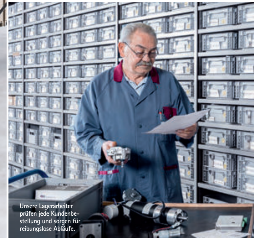
Unsere Lagerarbeiter prüfen jede Kundenbestellung und sorgen für reibungslose Abläufe.