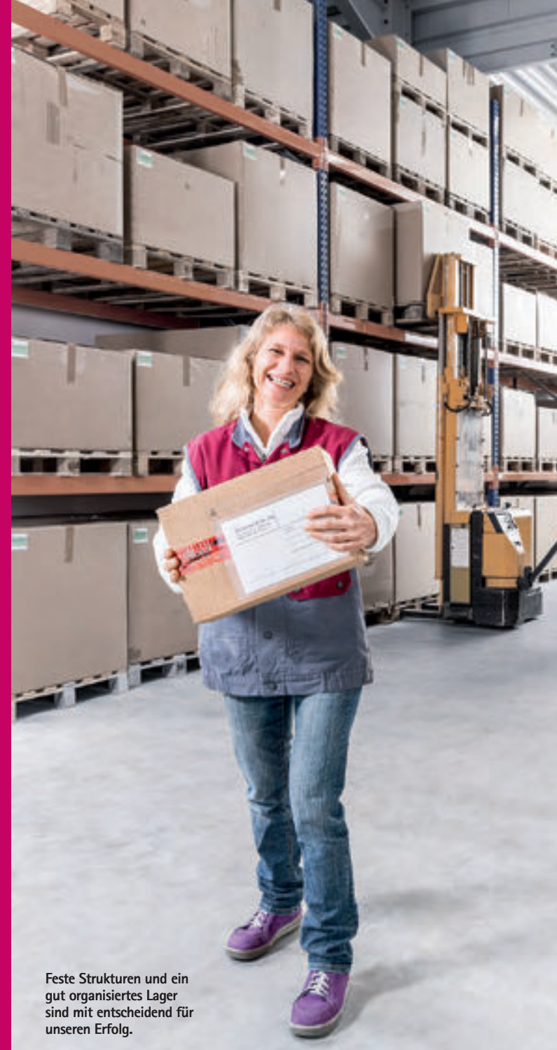
Feste Strukturen und ein gut organisiertes Lager sind mit entscheidend für unseren Erfolg.

Lernen Sie unser Mitarbeiter-Team kennen. Voller Motivation und Tatendrang sind unsere Leute für Sie da. Qualität steht bei uns nicht nur im Hinblick auf unsere Produkte im Fokus. Auch die Qualifizierung und stete Weiterbildung unserer Mitarbeiter und Mitarbeiterinnen ist für uns von großer Bedeutung. Viele unserer Stammkunden sagen: „Das ist spürbar.“